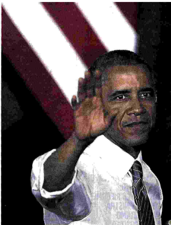
Il presidente americano Barack Obama

La crescita dell'economia americana avrà effetti positivi soprattutto sull'occupazione, mettendo in moto un circolo virtuoso che alimenterà i consumi contribuendo all'aumento del Pil. Ma, paradossalmente, l'accelerazione della ripresa rischia di aumentare le pressioni sulla Banca centrale americana per un abbandono anticipato della politica espansiva. La palla è in mano a Janet Yellen, il numero uno della Federal Reserve che fra poco festeggerà il primo anno del suo mandato. Per una decisione bisognerà però attendere i dati del quarto trimestre che, secondo la maggior parte degli analisti, non saranno come quelli del terzo.