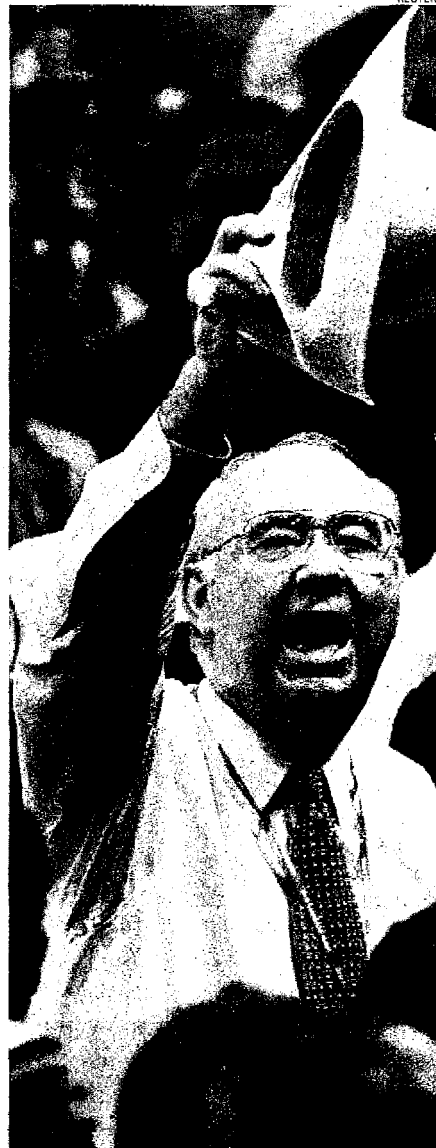
Deregulation. Phil Gramm, principale consigliere economico di John McCain, è candidato ad essere il futuro segretario del Tesoro